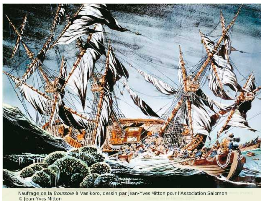
Naufrage de la Boussole à Vanikoro, dessin par Jean-Yves Mitton pour l'Association Salomon © Jean-Yves Mitton

Harcelés de nuit par une tempête tropicale (ou un cyclone), les frégates découvrent les récifs d'une île inconnue: Vanikoro. Sur cette île volcanique les fonds aux abords des récifs sont rapidement inaccessibles. Les navires ne peuvent mouiller et vont se disloquer sur la barrière de corail.