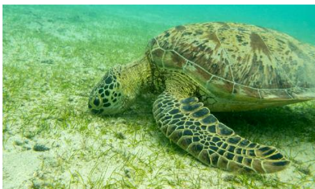
Tortue verte Chelonia mydas dans l'herbier de N Gouja à Mayotte

Les requins participeraient à l'équilibre et à la bonne santé des écosystèmes marins. Plusieurs études scientifiques ont démontré que ces super-prédateurs régulent le fonctionnement des réseaux alimentaires. En se nourrissant en priorité de proies faibles ou malades, ainsi que de cadavres, la pression exercée par les requins est qualifiée de « contrôle par le haut ». Si un maillon est perturbé, c'est l'édifice tout entier qui peut être menacé.