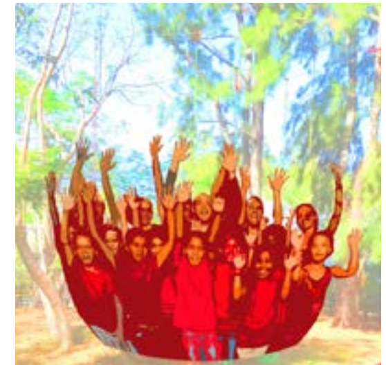
visuel : © BouftanG