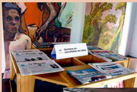
La salle d'actualité