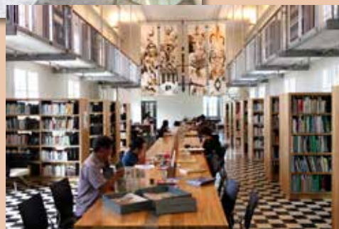
La salle de lecture