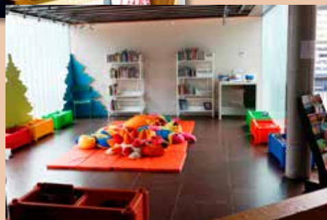
Espace d'activités des jeunes publics