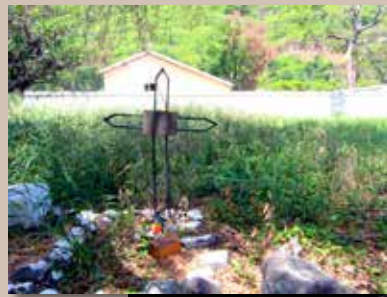
Le cimetière du Lazaret

Grâce aux progrès de la médecine et à la création du passeport sanitaire, le Lazaret est fermé en 1936.