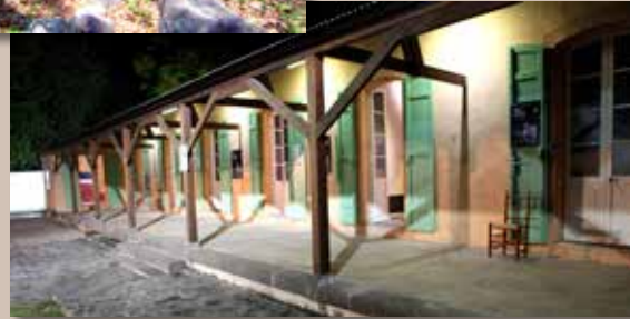
Aussitôt débarqués, les engagés ne sont pas directement acheminés vers leur lieu de travail, mais internés aux lazarets.