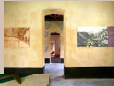
Aujourd'hui, L'infirmerie du lazaret 1 abrite l'exposition «Le Lazaret de la Grande-Chaloupe : engagisme et quarantaine ».