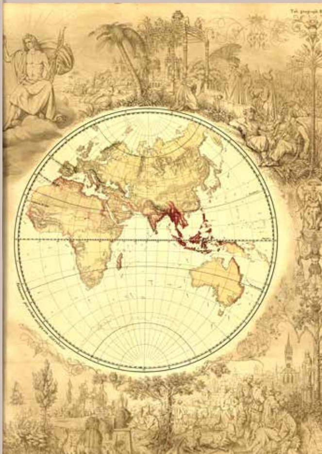
Palmarum per orbem antiquum distributio, estampe, 1823-1850.