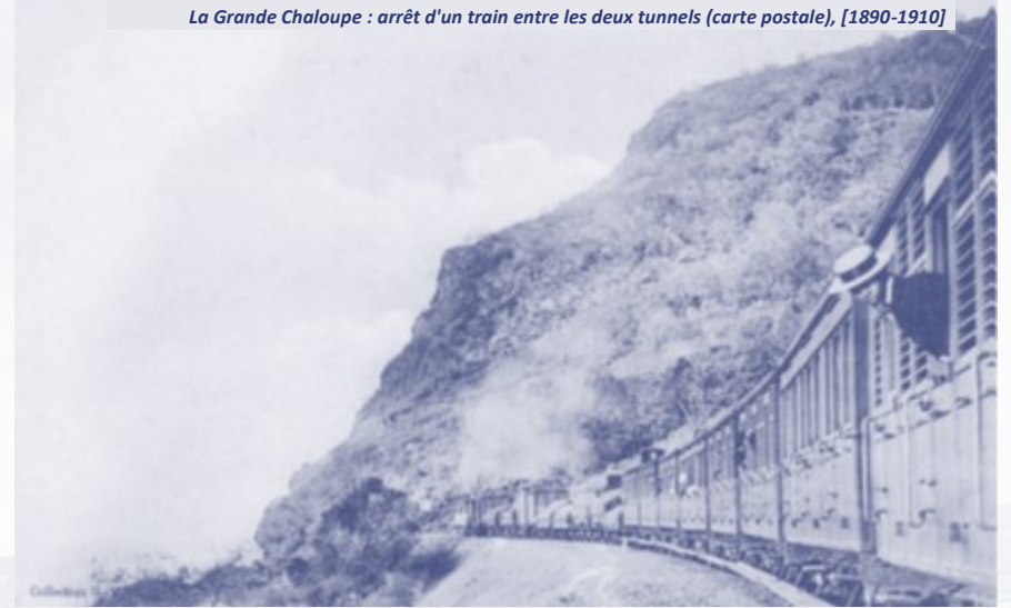
La Grande Chaloupe : arrêt d'un train entre les deux tunnels (carte postale), [1890-1910]

Question 4 : Coche les adjectifs qui décrivent le mieux le train, selon toi.