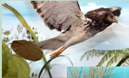
Au premier étage, une exposition permanente sur la faune des îles de l'Océan Indien.