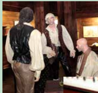
Exposition temporaire « Le Voyage de Monsieur de Lapérouse »