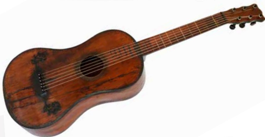
Guitare de Célimène. Musée Historique de Villèle