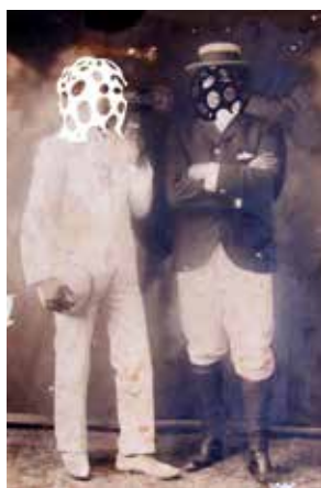
AR-15- 013_2013_«Cousins»_ Color photograph