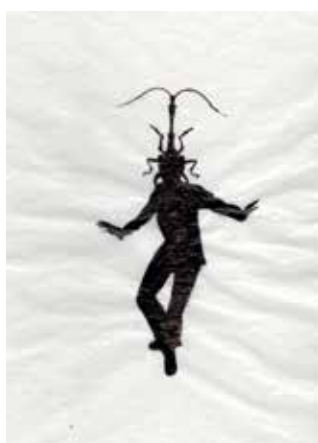
AR-15- 007_2013_«HybridGiraf»_ India ink on cellulose paper