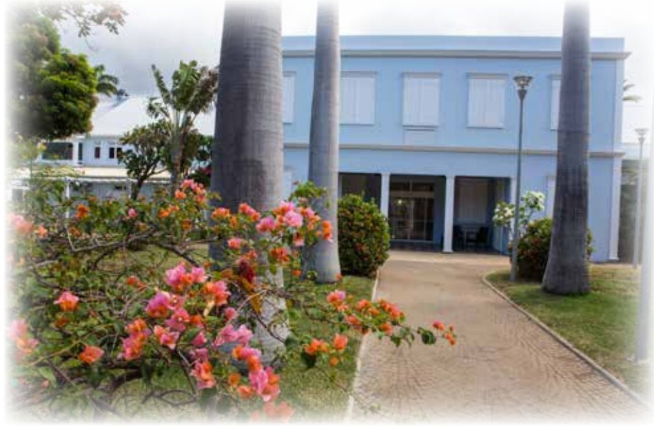
Direction de la Communication • Septembre 2015 • Photos : Bruno Bamba