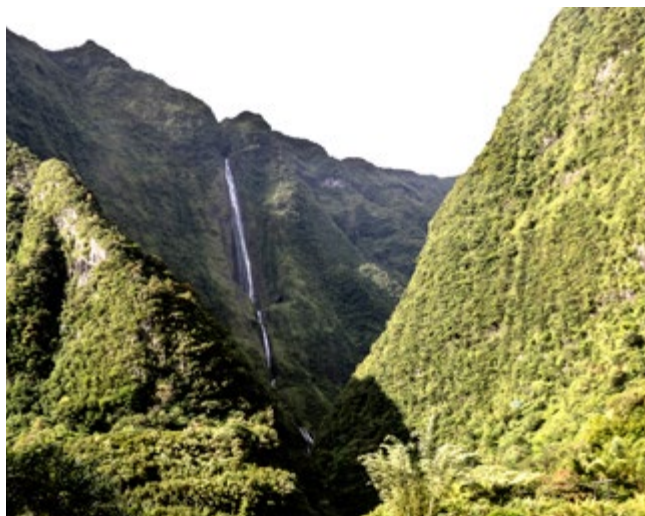
Une cascade majestueuse

Durée : 1 h30 Distance : 3 km Dénivelé positif : 150 m Niveau de difficulté : moyen