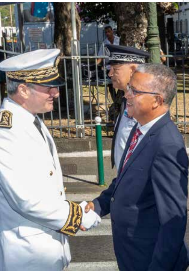
17/06/19 Prise de fonction du Préfet Jacques Billant.