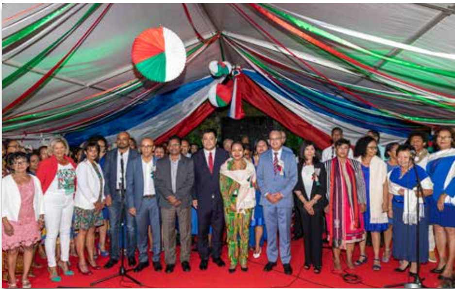
27/06/19 Fête nationale Malgache.