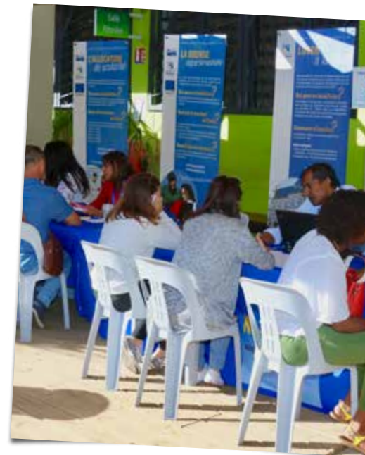
29/06/19 Matinée d'information pour les candidats à la mobilité.