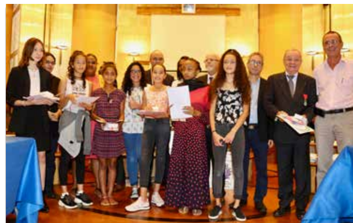
07/06/19 Concours « défense et illustrations de la langue française ».