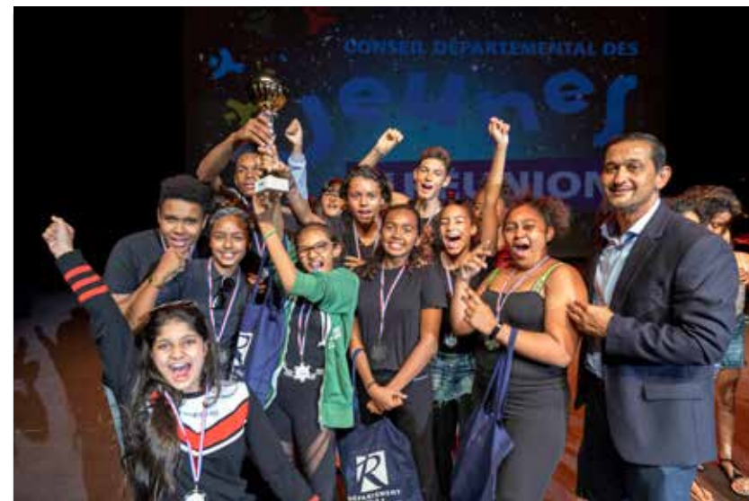
20/06/19 Concours de slam et danses urbaines 2019.