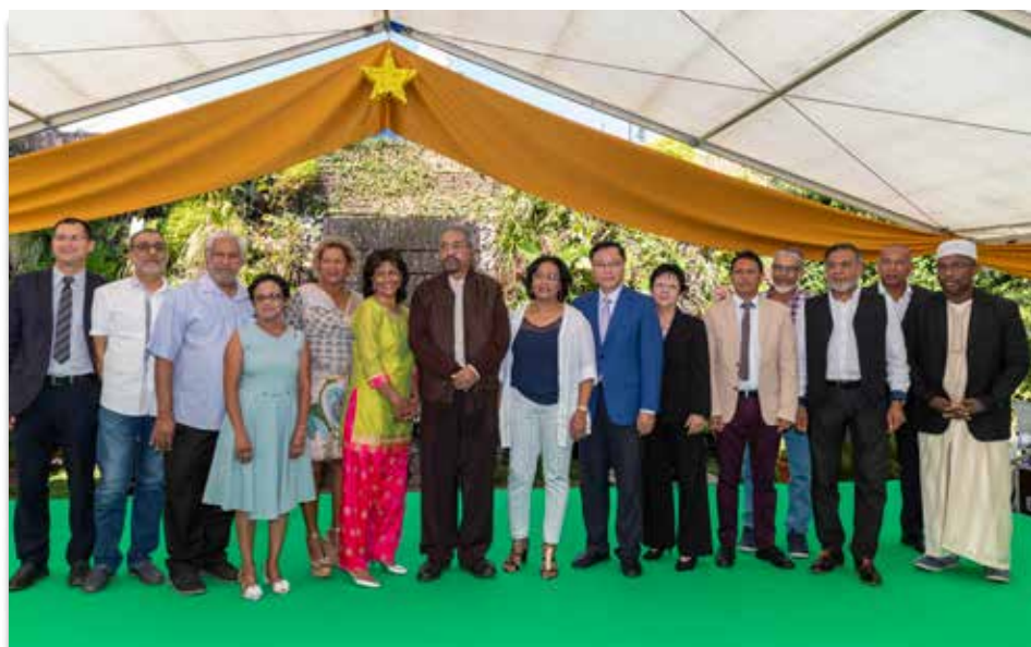
30/06/19 Fête de l'Eid 2019.