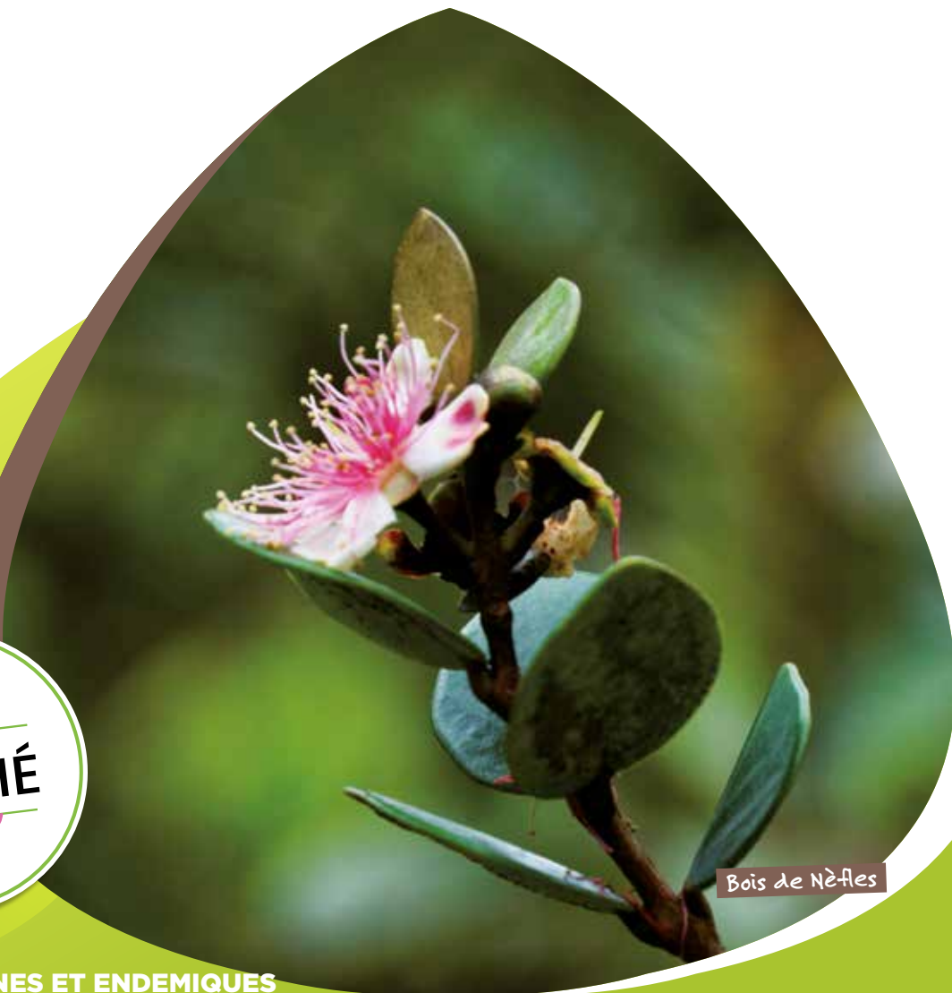
Bois de Nèfles