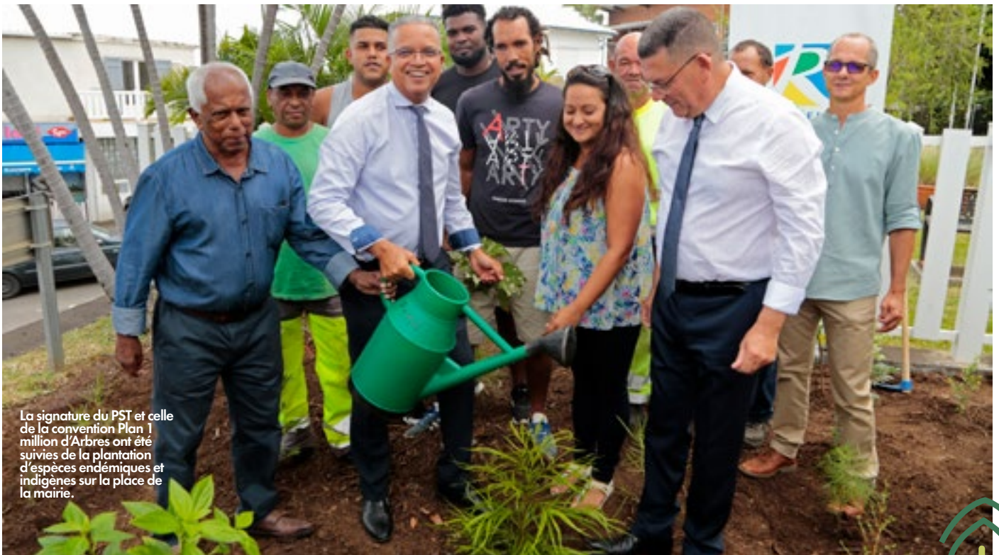
La signature du PST et celle de la convention Plan 1 million d'Arbres ont été suivies de la plantation d'espèces endémiques et indigènes sur la place de la mairie.

Le Conseil départemental poursuit le déploiement de son dispositif d'accompagnement des communes dénommé Pacte de Solidarité Territoriale (PST).