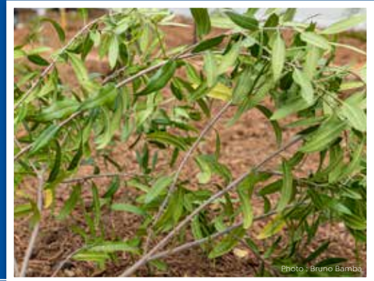
Bois d'olive blanc Olea lancea