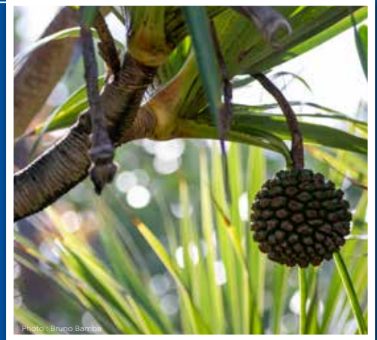
Vacoa Pandanus utilis