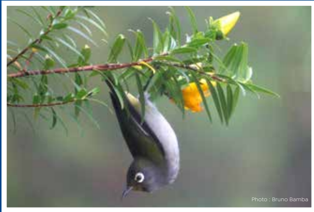
Oiseau lunette vert Zosterops olivaceus Protégé