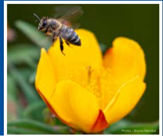
Fleur jaune Hypericum lanceolatum