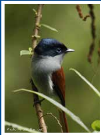
Oiseau la vierge Terpsiphone bourbonnensis Protégé par arrêté ministeriel