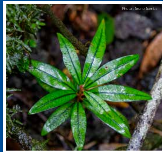
Bois de rongue Erythoxylum laurifolium