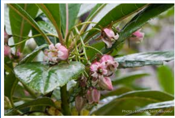
Bois Laurent Martin Forgesia racemosa