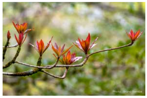
Benjoin Terminalia bentzoe