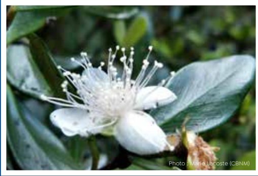
Bois de nêfles Eugenia buxifolia