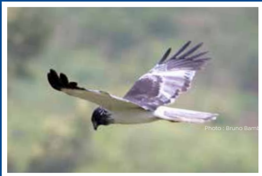
Busard de Maillard ou Papangue Circus maillardi Protégé