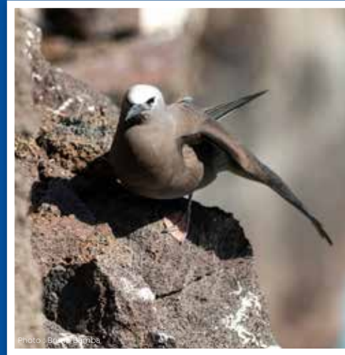
Macoua Anous stolidus