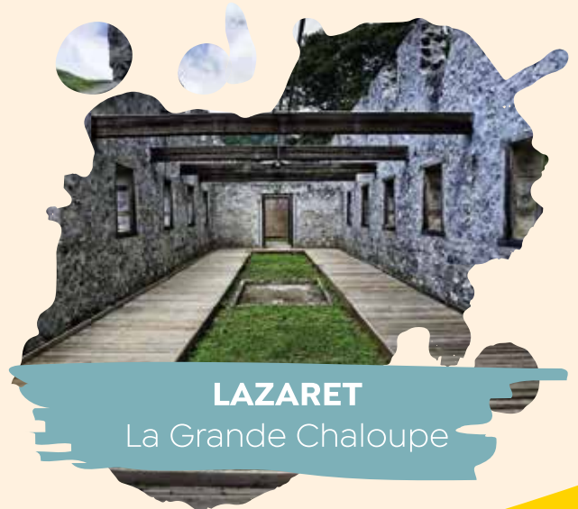
LAZARET La Grande Chaloupe