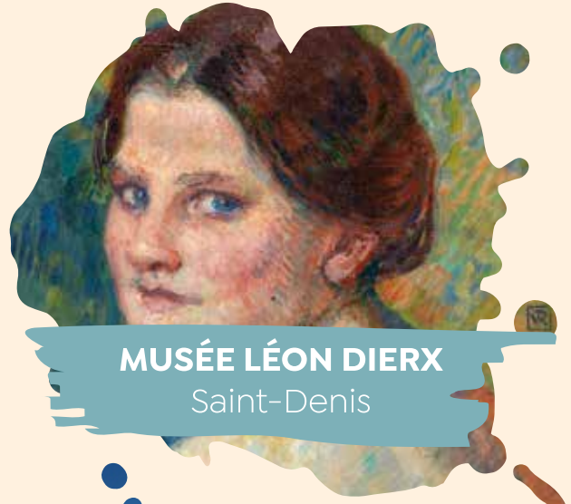
MUSÉE LÉON DIERX Saint-Denis