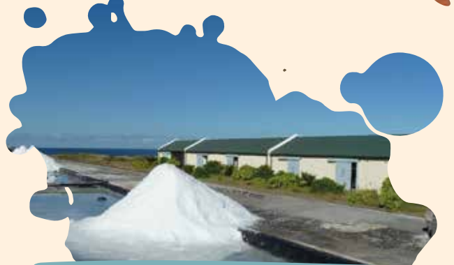
MUSÉE DU SEL Saint-Leu