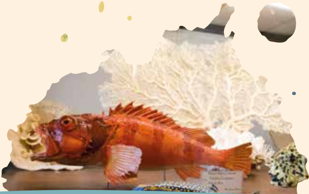
MUSÉUM D'HISTOIRE NATURELLE Saint-Denis