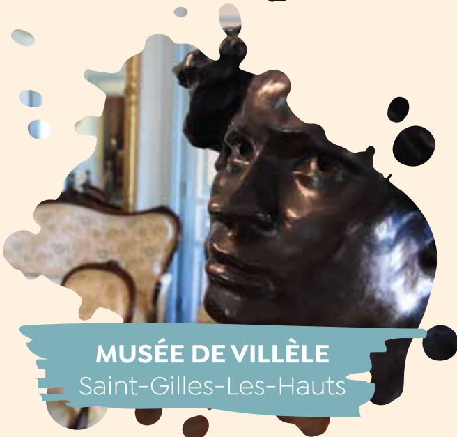
MUSÉE DE VILLÈLE Saint-Gilles-Les-Hauts