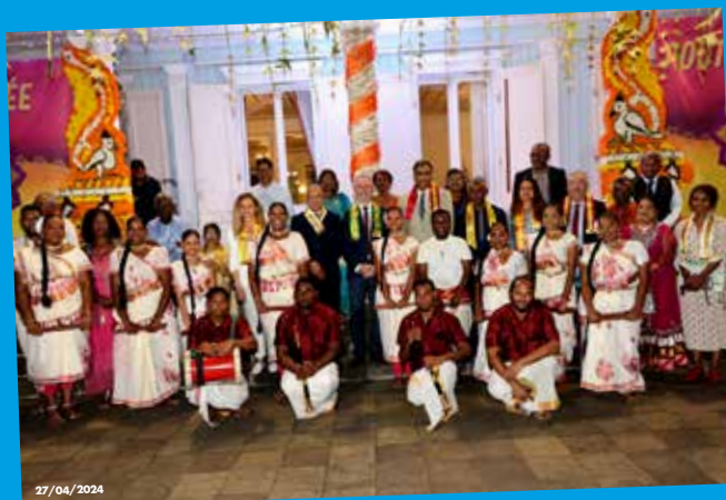
Cyrille Melchior reçoit Aurore Bergé, Ministre chargée de l'Égalité entre les femmes et les hommes, pour échanger notamment sur la thématique des violences intrafamiliales.