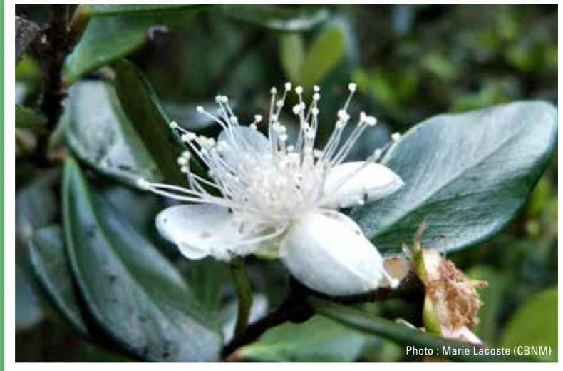
Bois de nêfles Eugenia buxifolia

Certaines de ces espèces sont endémiques de La Réunion